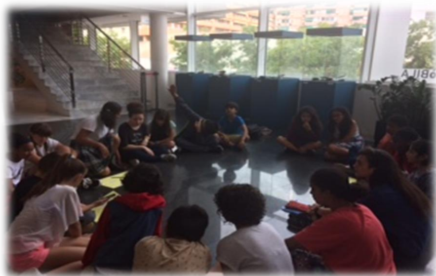
Grupo de trabajo. Primaria Marzo de 2018 Informe de Resultados

Es un órgano DEMOCRÁTICO DE PARTICIPACIÓN donde a través de la implicación en temas de INTERÉS CIUDADANO que les preocupan y les interesan se realizan propuestas para mejorar la ciudad, que ponen a disposición del Gobierno municipal. Está integrado por alumnado de primaria/secundaria. Los Consejeros/as trabajan en grupos de 10-15 chicos/as agrupados por zonas educativas. El plenario del Consejo se reúne 3 veces al año (al empezar el curso para proyectar el trabajo, a medio curso para hacer el seguimiento y, al final, para el cierre y la valoración). (Folgueiras, Cano, Venceslao (en prensa)).